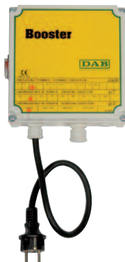
Coffret de démarrage BOOSTER à double condensateur.